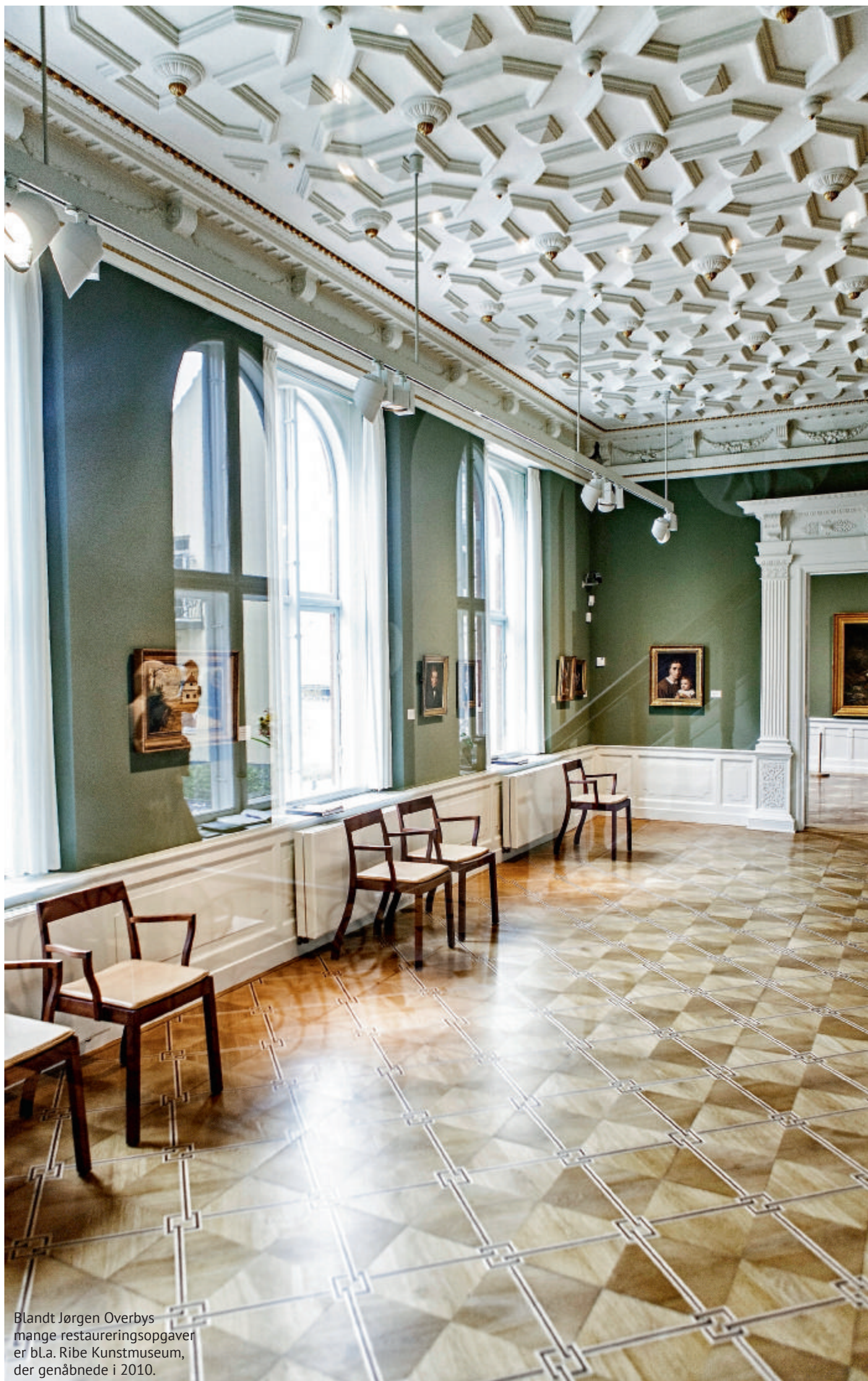
Blandt Jørgen Overbys mange restaureringsopgaver er bl.a. Ribe Kunstmuseum, der genåbnede i 2010.

“Jeg tænker, at hvis man som arkitekt går rundt med den ambition, at man vil skabe store monumenter, som f.eks. den tyske arkitekt Albert Speer, der drømte om at skabe noget, der varede ind i evigheden, så kan man med restaureringsopgaver faktisk få en meget læn-