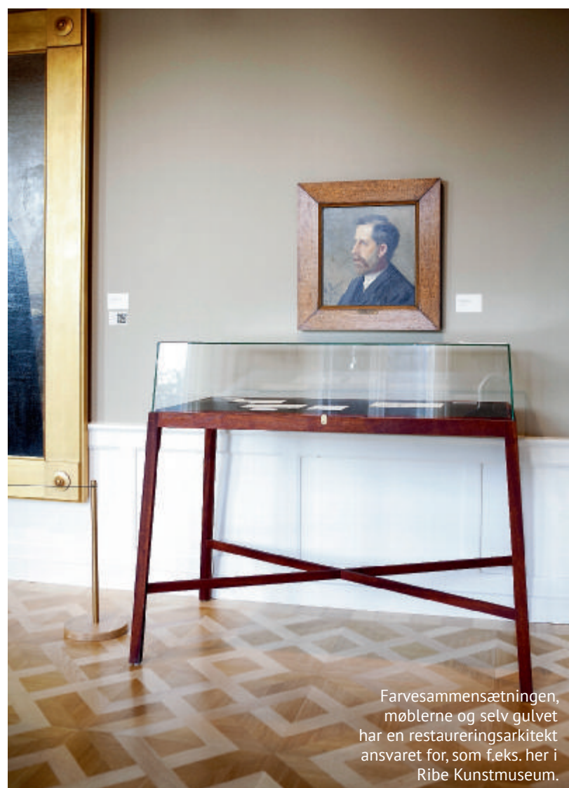
Farvesammensætningen, møblerne og selv gulvet har en restaureringsarkitekt ansvar for, som f.eks. her i Ribe Kunstmuseum.